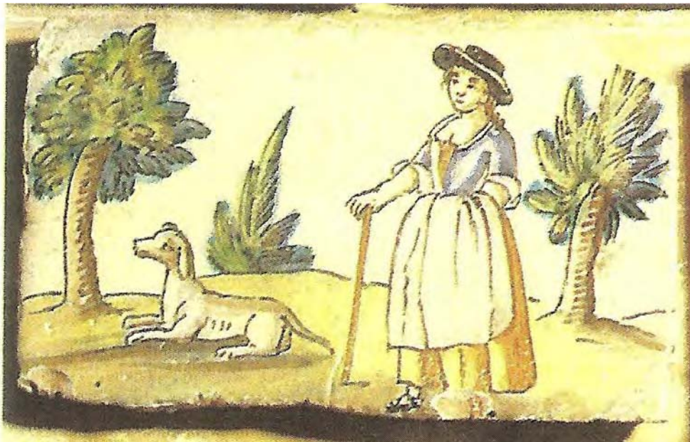
Rajoles polícromes a Mallorca amb una pagesa amb un ca. Rajoles de Manises, segle XVIII (Cabot i Mulet, 1990).

Crida manant denunciar tots els cans podencs.