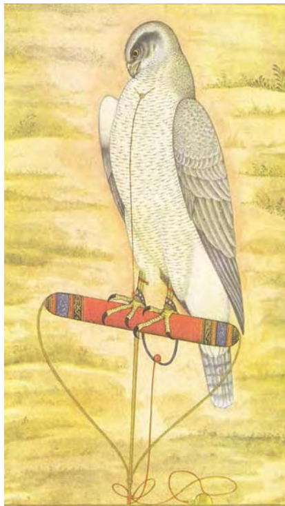
Miniatura índia de falconeria, Astor ( Accipiter gentilis ).

Davant la situació exposada el governador mana fer una crida pública prohibint la captura de perdius amb caldera i filats, sots pena de 25 lliures i de perdre els estris. (Cateura 1981: 256-257; Rosselló & Albertí 2003: 208).