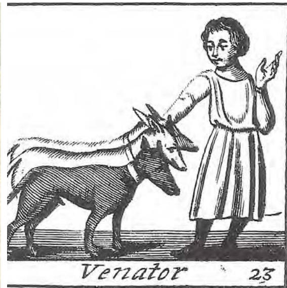
Reproducció de les figures de les Lleis Palatines (esquerra). Dreta, representació de les imatges de les Lleis Palatines en que es representen els oficis, en aquest cas del cuidador dels cans o caners (dreta).