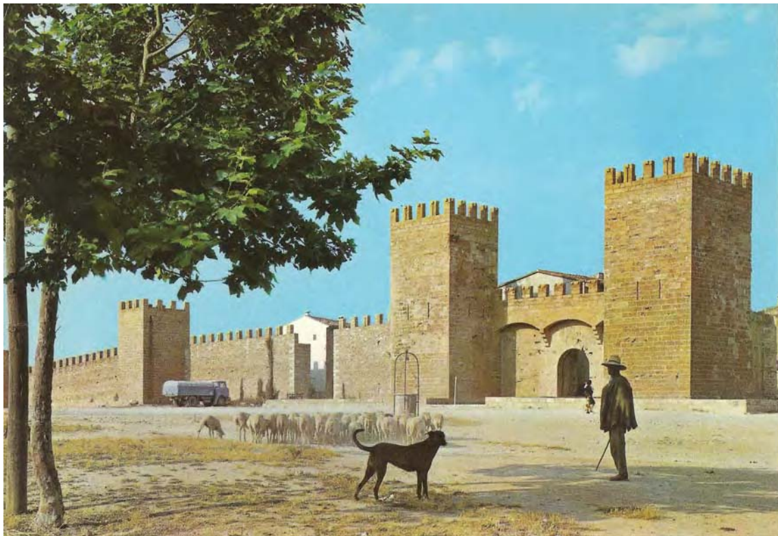
Ca de bou amb un ramat d'ovelles a les Murades d'Alcúdia. Postal Alcúdia. Detalle de sus muralles (1967).

“De la claveguera de devora al convent del Socós, qui surt al vall, ha surtit un diforme drac y és caigut dins el vall: li han amollat cans de bou y si és escondit; se fan diligències á veurer si lo agafaran”. (Campaner 1984: 607).