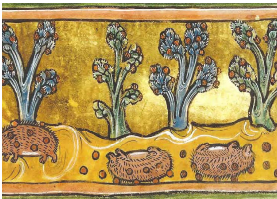
Imatge medieval d'un eriçó que es revolca per terra per agafar fruits.