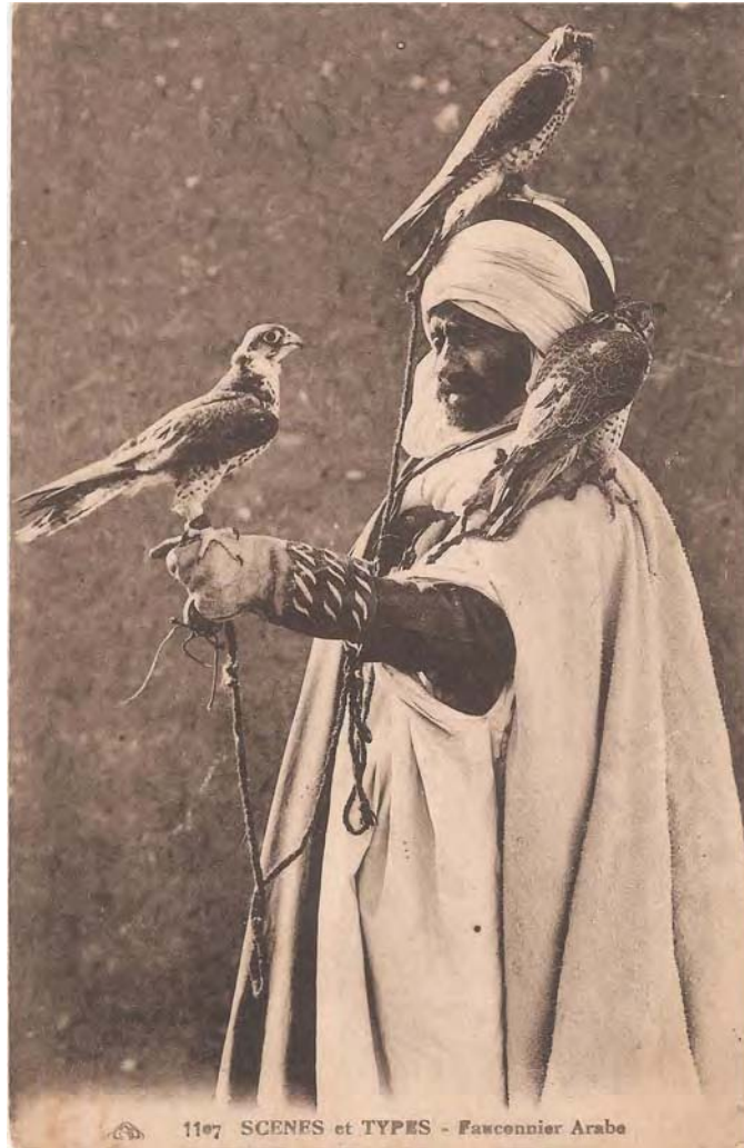
Falconer àrab.

Al ser de cria domèstica i fàcils d'obtenir, era utilitzada en falconeria per treure els conills de la lloriguera. (Querol 2003: 262, s.v.: mostela).