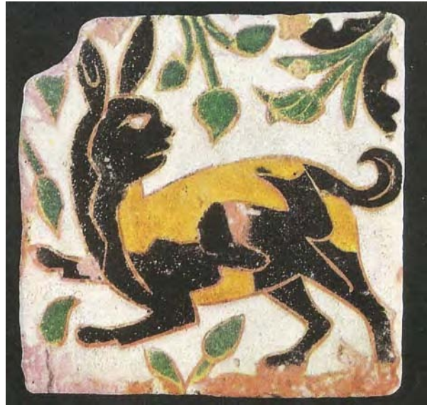
Distintes rajoles de conills. Dreta extretra de Cabot i Mulet (1990). Esquerra extretra de Berendsen et al. (1977).