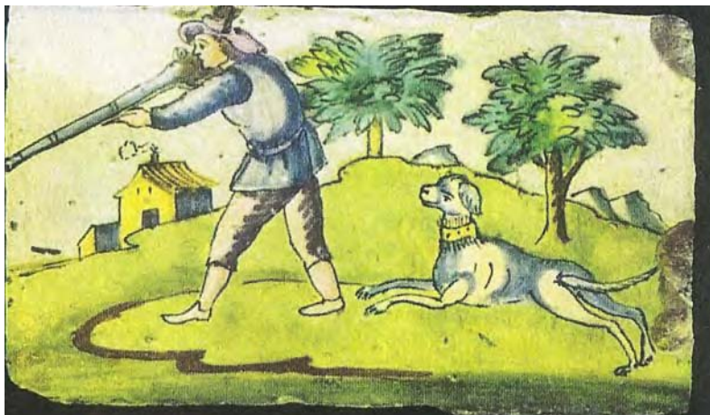
Rajola de caçaria amb ca. Extret de Berendsen et al. (1977).

1756, 6 març. Noticiari de Nicolau Ferrer de Sant Jordi i Figuera: "Se ha publicat un pregó de ordre del Rei ... que ningú pugua anar a caçar amb companyia de altres sinó cada u tot sol amb dos cans únicament, i que ningú no gos de privilegi pugua anar a caçar, pena de presidi tota la vida" (Rosselló 2005: 989).