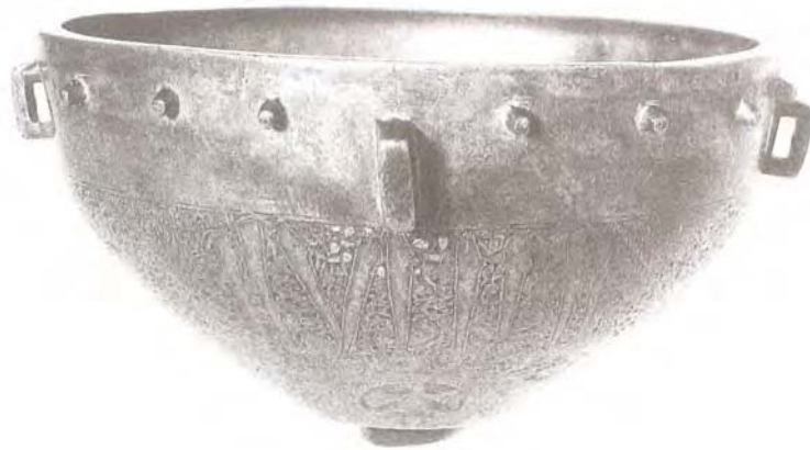
Timbal per aixecar la caça, de bronze amb incrustacions d'argent que representen lletres àrabs. Extret de Ghatrif (2000), Acta Bibliothecae Regia Stokholmiensis, 65.

els perdiguers per a la la perdiu ( Alectoris rufa ), els raters per a les rates ( Rattus norvegicus , Rattus rattus ), els tortiguers per a les tortugues ( Testudo sp.), etc.