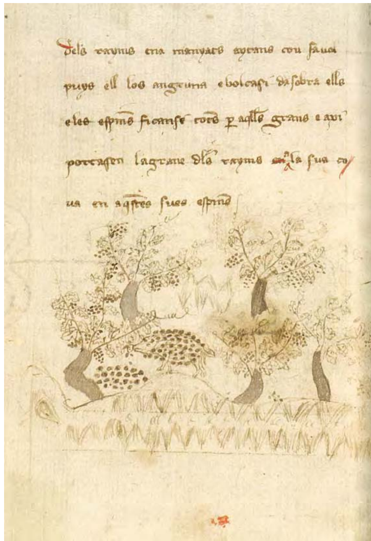
Escena de l'eriçó del Bestiari català manuscript 310 de la Biblioteca de Catalunya, que descriu el transport de grans de raïm clavats a les seves espines.