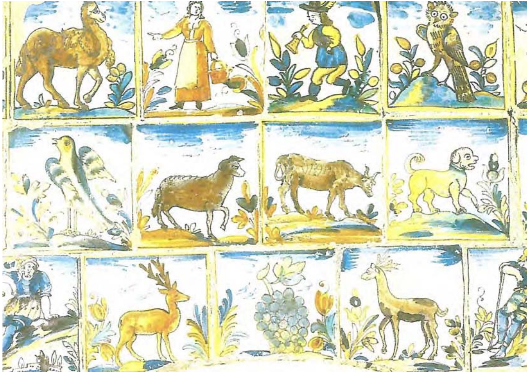
Distintes imatges d'animals de rajoles policromes mallorquines. Rentamans del convent de Santa Clara de Palma. Extret de Cabot i Mulet (1990).

Clot des Cero: petita cavitat del terme de Calvià situada a la serra de Na Burguesa al costat occidental del Puig Gros de Bendinat. Cal recordar que les terres de la família Burgues entre Palma i Calvià hi havia cérvols. Aquest topònim també pot estar relacionat amb el nom de la falguera Phyllitis sagittata , Llengua de cero, doncs en aquesta cavitat es trova una abundant població d'aquesta rara espècie.