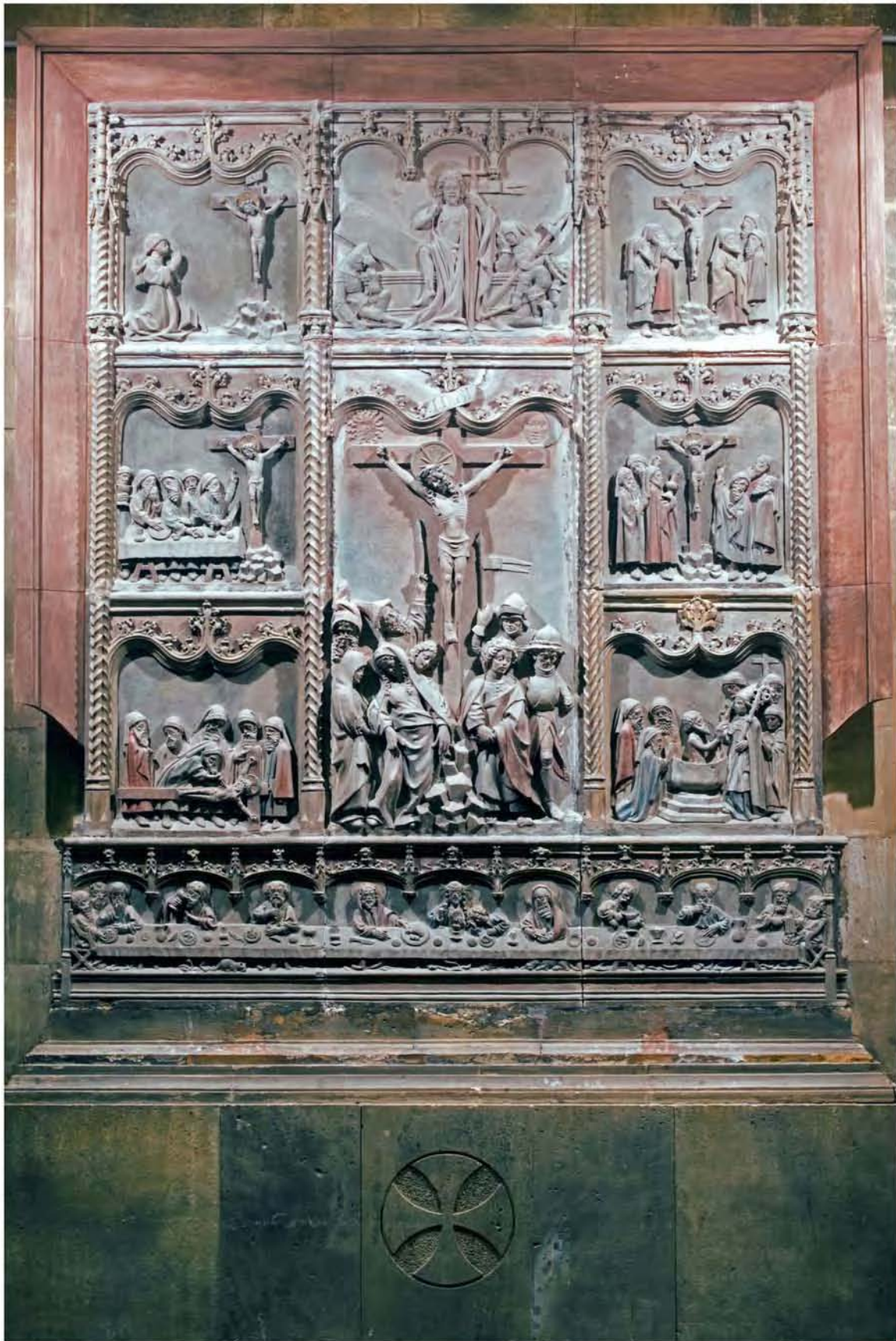
Imatge completa del retaule del Santuari de Sant Salvador (Felanitx). A la iconografia inferior, imatge del Sant Sopar a on són figurats un ca i un moix (vegeu portada del llibre i veureu el ca en detall).