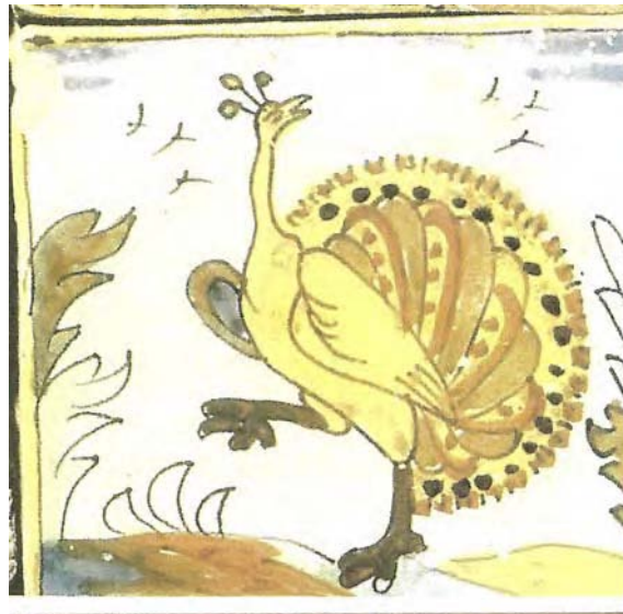
Rajola amb paó mascle, extret de Cabot i Mulet (1990).