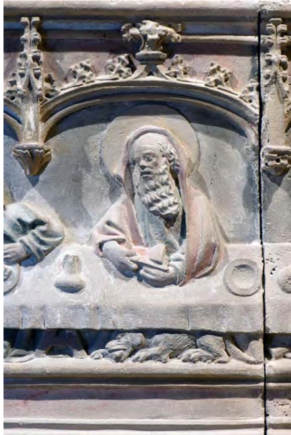
Detall de l'apòstol a la taula i el ca del retaule del Santuari de Sant Salvador (Felanitx).