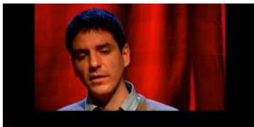
La Sibil·la Patrimoni de la Humanitat per la UNESCO.wmv