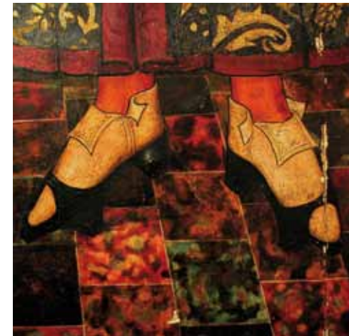
Calçat d'home a l'Edat Mitjana. Detall del retaule de Sant Cosme i Sant Damià (autor anònim. Mallorca, segle XV)