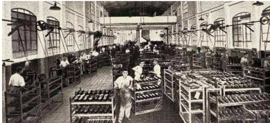
Recinte de treball de la fàbrica Melis de calçat d'Inca (ca. 1930)