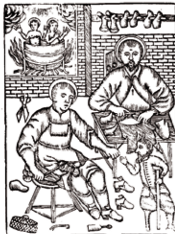
Sants patrons de l'ofici de sabater, Sant Crispí i Sant Crispinià. Estampa popular

L'edifici, rehabilitat com a museu, fou inaugurat el 2 de juny de 2010 i comprèn un espai d'àmplies dimensions que s'articula en dues plantes rectangulars; una de principal destinada a sala d'exposicions temporals, magatzem i despatxos, i un primer pis que recrea una fàbrica de calçat amb eines mecàniques de les diferents tasques del seu procés de producció utilitzades a Inca a la primera meitat del segle XX.