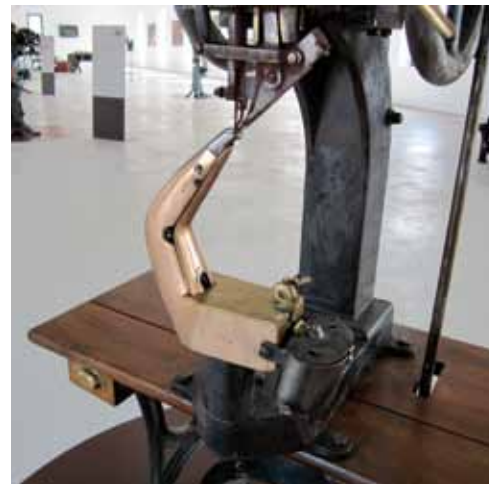
Sala d'exposició del museu. Maquinària de producció de calçat d'Inca a la primera meitat del segle XX

La finalitat és subratllar la importància del calçat com a complement indispensable de la indumentària i, per tant, de l'evolució del vestit, distingint-lo com a indicador fonamental de l'home civilitzat, en tant que és embolcall del peu nuu, i per extensió també com a dictaminador de la moda i, així doncs, vinculat al món de la creació artística.