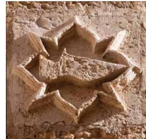
Emblema medieval del gremi de sabaters a Mallorca