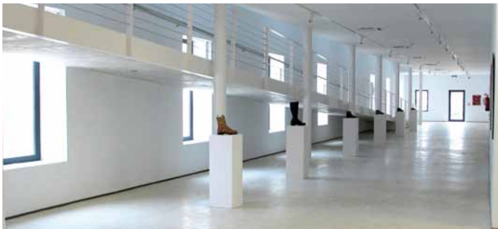
Sala d'exposició de la planta baixa