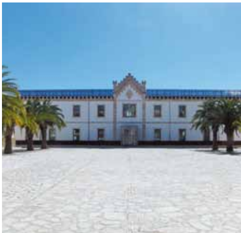
Antic pavelló militar, seu actual del museu del calçat