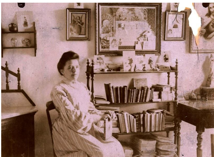
Fotografies procedents del fons Salvà a la Biblioteca Lluís Alemany, Palma.